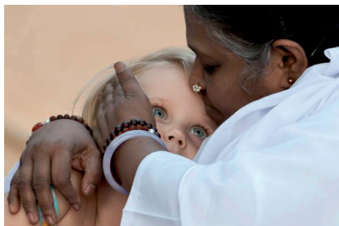
Amma embrasse le monde - c'est le Darshan

Le mouvement Slow Cosmétique, marque déposée qui milite depuis 2012 pour une beauté engagée qui soit vraiment naturelle et humaine accueillera en exclusivité dès le 1er octobre 2015 sur sa boutique www.slow-cosmetique.com les cosmétiques naturels d'AMMA. Les cosmétiques Amrita Organics rejoindront ainsi les 66 marques lauréates de la Mention Slow Cosmétique rassemblées pour un shopping 100% naturel !