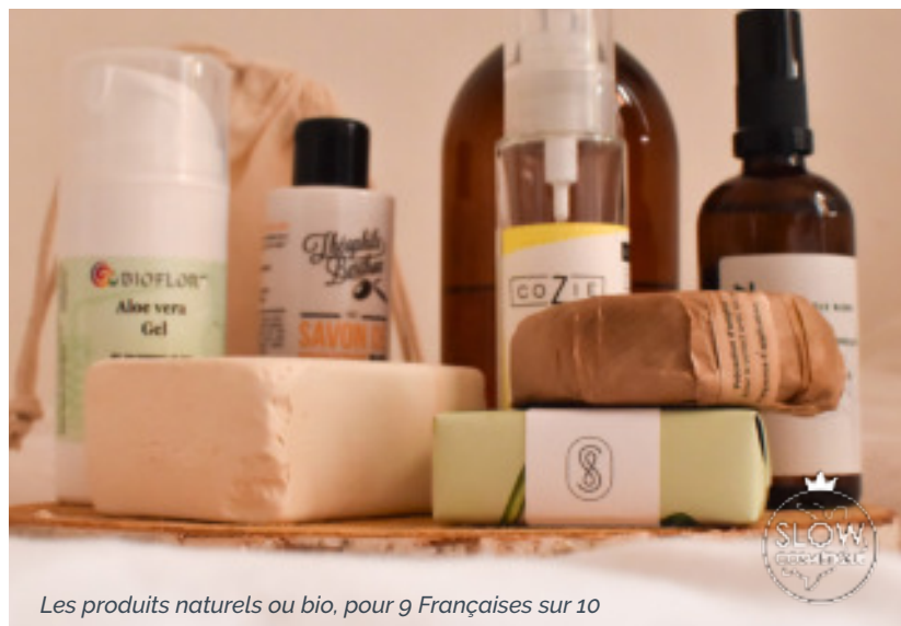
Les produits naturels ou bio, pour 9 Françaises sur 10