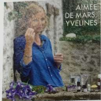
AIMÉE DE MARS YVELINES